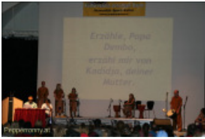
Foto-Impressionen der Veranstaltung