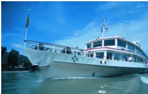
Mit diesem Schiff erkundeten die „Zuwanderer“ die neue Heimat OÖ

Am 14. August 2010 organisierte der Kulturverein Jonathan Bazar einen Vereinsausflug mit dem Ziel, die „neue“ Heimat der Afrikaner zu erkunden und die Kultur und die Menschen besser kennenzulernen und zu verstehen. Mit seiner großen Anzahl an Seen und Flüssen kann Österreich mit einem großen Angebot an Schifffahrtsattraktionen aufwarten.