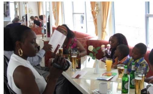
Ein Vereinsmitglied beim Aussuchen einer typisch österreichischen Speise

Das sind hauptsächlich Rundfahrten auf den größeren Seen, oder Fahrten auf der Donau. Somit stand für den Obmann fest, dass der diesjährige Ausflug mit dem Schiff auf der Donau stattfinden wird, da dies sich bestens zum Entspannen und Genießen eignet, aber auch das Anlegen am Hafen die Gelegenheit bietet, die Ortschaften zu erkunden.