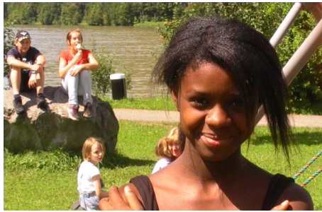
So sieht die multikulturelle Gesellschaft in OÖ aus. Ziel sollte ein Zusammenleben ohne Ausgrenzung sein.

angeboten, was sehr zur Freude der „Reisenden“ war, da das Ziel der Veranstaltung ohnehin war, die „neue“ Heimat besser kennenzulernen, was somit auch das Essen beinhaltet. In Schlögen war Endstation und die Vereinsmitglieder besichtigten den Ort und staunten über den schönen Hafen, bis das Schiff zur Rückfahrt aufbrach. Um 17.30 Uhr legte das Schiff wieder in Linz am Hafen an und die Vereinsmitglieder waren sehr