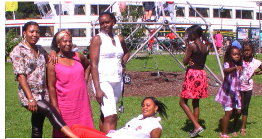
Trotz einer anstrengenden Reise waren alle Teilnehmenden guter Laune

müde von der „anstrengenden Reise“, aber dennoch guter Stimmung. Insgesamt bot die Schifffahrt für die Afrikaner ein unvergessliches landschaftliches Erlebnis und viele neue Eindrücke. Auch dem Ziel, die „neue“ Heimat besser kennenzulernen und zu erfahren, wie die Bevölkerung in Oberösterreich lebt, kamen alle Teilnehmer wieder einen Schritt näher.