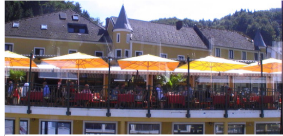
Die Endstation Schlögen

die Möglichkeit, die alte Kirche zu besichtigen. Nach einer interessanten Führung ging die Reise weiter nach Aschach, Unter- und Obermühl, wo nun auch für das leibliche Wohl der Vereinsmitglieder gesorgt wurde. Am Schiff wurden typisch österreichische Speisen