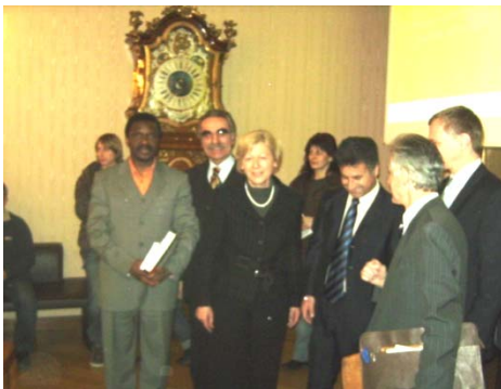
Obmann Nkumba Tossanga (li.) mit Frau Landtagspräsidentin Orthner (Mitte) und Klubobmann Mag. Stelzer (rechts hinten)

knüpfen. Den zahlreich erschienenen Vereinsvertretern wurde ein herzlicher Empfang bereitet, der sich nicht nur auf dieses Treffen bezog, sondern als Ausdruck des Willkommen-Seins im Land Oberösterreich verstanden werden kann.