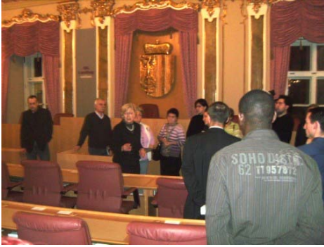
Der Landtagssaal, die Stätte der Gesetzgebung Oberösterreichs

werden können, wobei jeder seine Fähigkeiten miteinbringt. Durch das Bilden von Netzwerken wird der rege Austausch über alle Ebenen hinweg gefördert: auch hier wird nicht ausgegrenzt sondern miteinbezogen, einbezogen und nicht eingeordnet, wie es im Integrationsleitbild ausgedrückt wird. Der Kulturverein Jonathan Bazar begrüßt diese Einstellung, und wir bedanken uns herzlich für die Einladung.