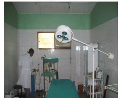
Diese Abbildung zeigt einen Operationsaal in der Klinik Lukunga

Da das Zentrum an der Peripherie liegt, ist es bei Behandlungen wie z.B. Kaiserschnitten und anderen Fällen, die eines Eingriffs bedürfen, notwendig, dass diese stationär durchgeführt werden. Auch in diesem Bereich wird jährlich ungefähr 450 Patienten geholfen.