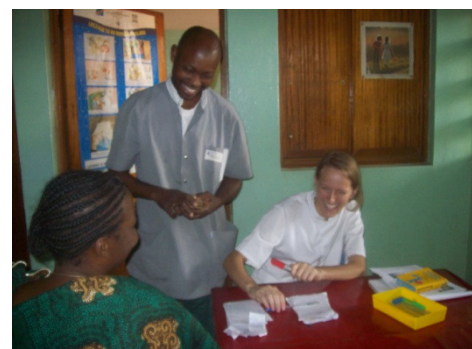
Die Behandlung der armen Bevölkerung wird zu sehr niedrigen Kosten angeboten

Das Spitalszentrum Lukunga in Malweka bietet zahlreiche Serviceleistungen an, die der armen Bevölkerung dieser Region zugutekommen. Eine medizinische Behandlung kostet 2.500 FC, also 2,3 Pfund für eine fünftägige Behandlung. Das Spitalszentrum behandelt umgerechnet täglich etwa