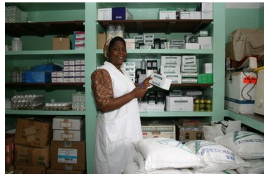
Der KVJB organisiert die Versorgung mit Medikamenten und medizinischen Materialien

Durch die Zusammenarbeit mit Pharmafirmen in Österreich kann der KVJB helfen, den Bedarf an den von der Station benötigten Materialien bereitzustellen. Dazu gehören z.B. Stethoskope, Spannungsmesser, Fieberthermometer, Tragbahnen, Atemgeräte für Asthmatiker und viele weitere medizinische Materialien. Auf diese Art und Weise werden Abnehmer in Afrika von den Pharmafirmen erreicht, während sich dieser wachsende und bedeutende Markt noch entwickelt. Eine bestmögliche Organisation und Durchführung des Transports stellt dabei sicher, dass die Güter unbeschadet und zollfrei am Zielort in die richtigen Hände gelangen, sodass unser Partner ordnungsgemäß voll und ganz von der Hilfe profitiert.