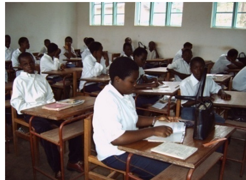
Eine neu entstandene Schule

Um sich direkt in Afrika sozial engagieren zu können beginnt der Kulturverein Jonathan Bazar eine Zusammenarbeit mit der im Kongo ansässigen Non-Profit-Organisation SADI (Afrikanische Solidarität für integrierte Entwicklung). Durch diese Kooperation kann der Kulturverein Jonathan Bazar mit Hilfe der