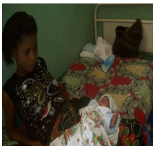
Täglich werden in der Frauenstation 6 Entbindungen durchgeführt

In der Klinik gibt es eine eigene „Station“ für Frauen. Die Frauenklinik hat eine Kapazität von 40 Betten und im Durchschnitt werden sechs Entbindungen täglich oder durchschnittlich 180 Entbindungen pro Monat durchgeführt.