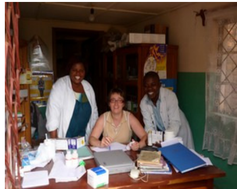
Der hohe Bedarf an Gesundheitsversorgung soll endlich zufriedenstellend gedeckt werden

Jetzt, nach 5 Jahren des Bestehens, möchte die Leitung der Klinik schließlich auf diesen Bedarf reagieren. Ein erster Lkw mit Geräten wurde losgeschickt, ein zweiter wird vorbereitet, und vor Ort wurden die Vorbereitungen für die Ausbauarbeiten in die Wege geleitet. Drei Gebäude werden für die zukünftige Nutzung gebaut bzw. renoviert: