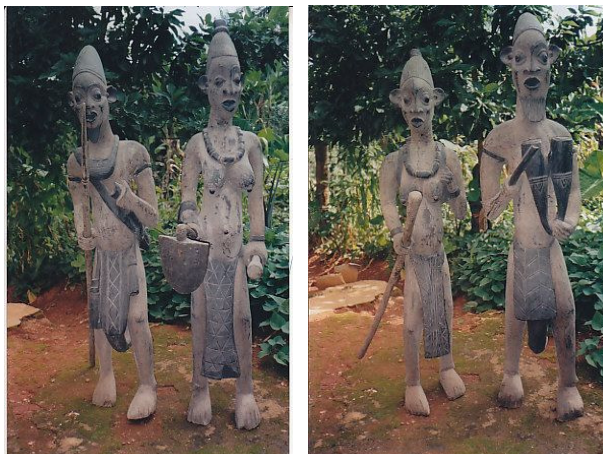
Diese Statuen sind Ausdruck von ständigen Kämpfen mit Nachbarstämmen und gelten als Symbol von Stolz bei den Tikaren

Die Tikar gehören zu den fleißigsten Menschen in Kamerun. Die Kunstschaffen der Tikar wurde als einer der Einflüsse auf das Kameruner Grasland angesehen und ist relativ eigenständig, während eine ethnologische Verwandtschaft zu den Bamum und Bamileke besteht. Die Tikar-Kunst hat einen eigenwilligen Stil, der vor allem in den lebensgroßen Köpfen mit Pflanzenfaser-